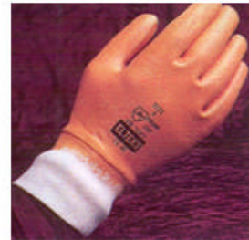
Resim1.3: Tulum, çizme ve eldiven