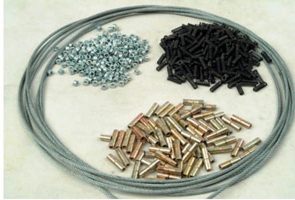
Resim 1.6: Elmas tel ve bağlantı elemanları

Mermer ocak işletmeciliğinde, ocaktan kütlelerin kesme işlemini yapan asıl eleman elmas teldir. Elmas tel olarak adlandırılan grup; çelik halatın üzerine özel olarak imal edilmiş elmas boncuklar, yaylar, sıkmacıklar ve pulların dizilmesi ile elde edilir. Elmas teller genellikle 5 – 10 – 15 metre uzunluklarda hazırlanır. Resim 1.65' te elmas teli oluşturan elmas boncuk, yay ve bağlantı elemanları görülmektedir.