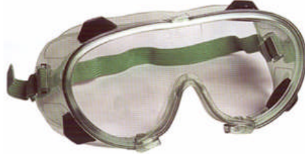
Resim 1.1: Gözlük