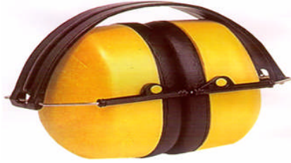
Resim 1.2: Kulaklık