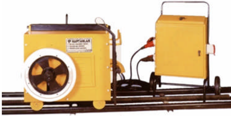
Resim 1.5: Elmas tel kesme makinesi